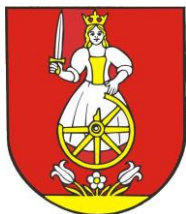
• Obecný erb